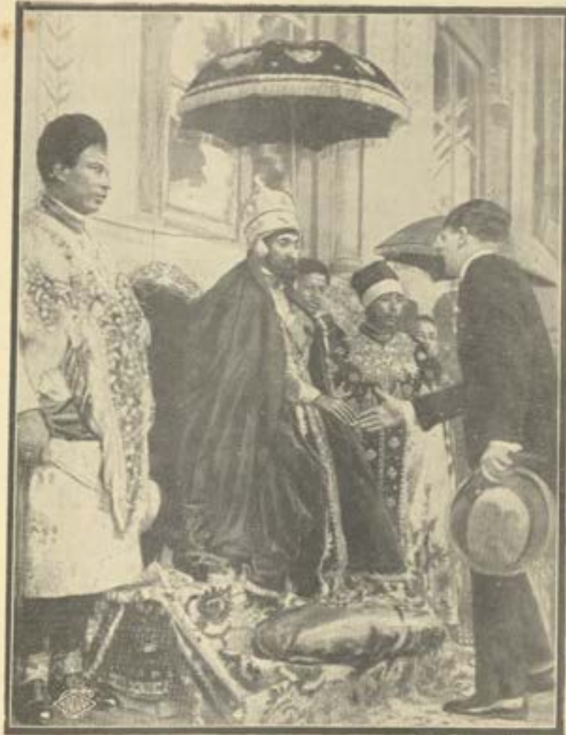
الرأس تفري بعد تتويجه امبراطوراً يستقبل احد الممثلين السياسيين الاوربيين

لمصر علاقة بالحبشة قديمة ترجع الى ايام العائلة الفرعونية الثانية عشرة اذ وصلت الجنود المصرية الى سفوح الحبشة واخذت في غزو المدن وسابها ونهبها . وفي عهد العائلة الثالثة عشرة تغلغل الجنود المصريون في البلاد الحبشية واستولوا عليها فاصبحت ايلة مصرية بولى عليها ابناء القراصة ويعمل الجند والموظفون المصريون فيها لنشر دينهم ولغتهم وأديهم وخلفوا هناك آثاراً كثيرة من الهياكل والمسلات وغيرها . وبقيت الحبشة تابعة لمصر حتى سنة ٩٣٠ قبل الميلاد المسيحي