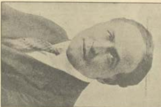
هوديني المشهور الذي وقف آخر حياته على كشف خداع الوساخا