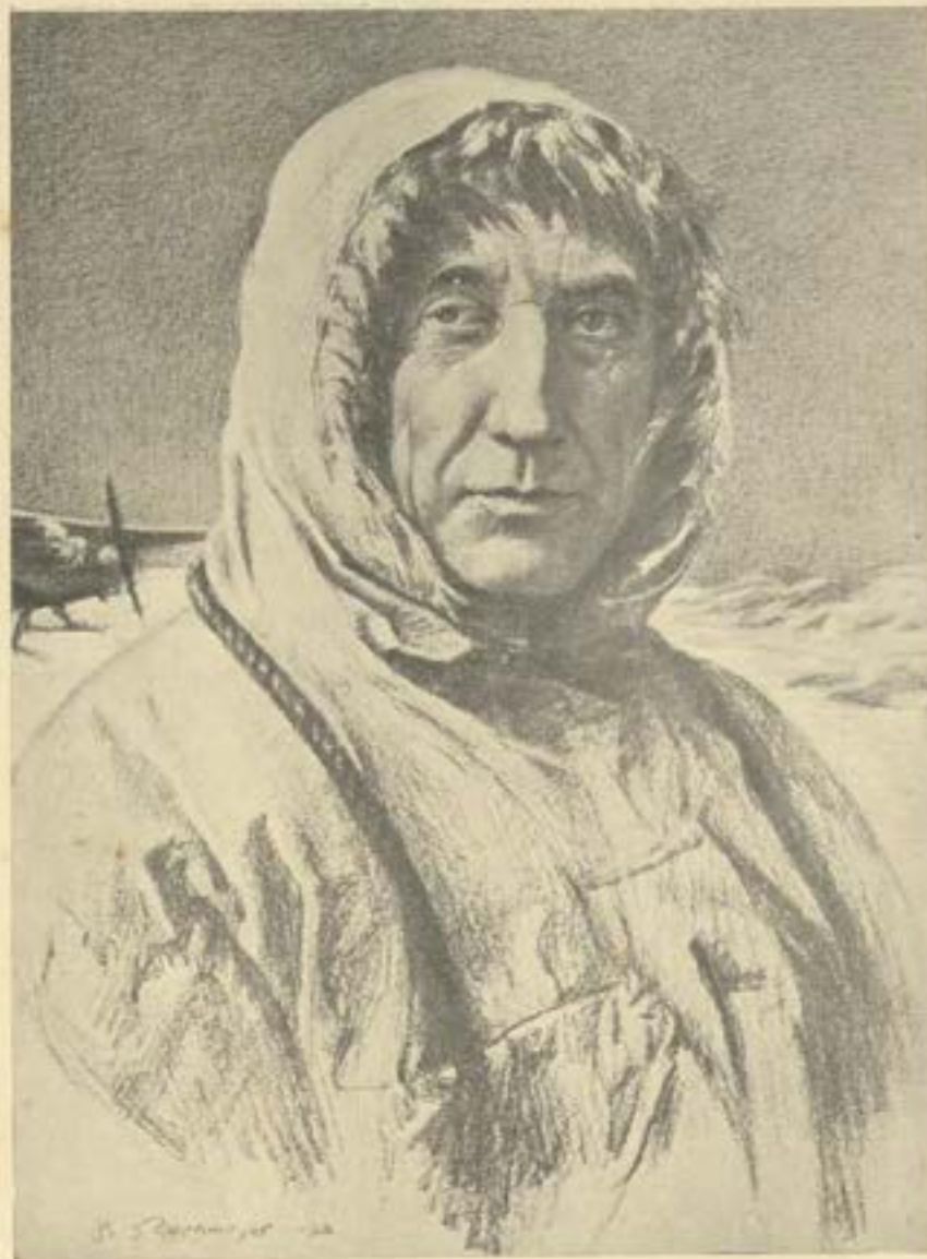
الرحالة الزوجي رولد امدنسن اول رجل بلغ القطبين

بعد ذلك نشبت الحرب الكبرى وتوقفت اعمال الريادة حتى وضعت الحرب اوزارها فجمع امدنسن من المال ما مكنته من اعداد بعثة لتحقيق رغبته القديمة وهي اجتياز