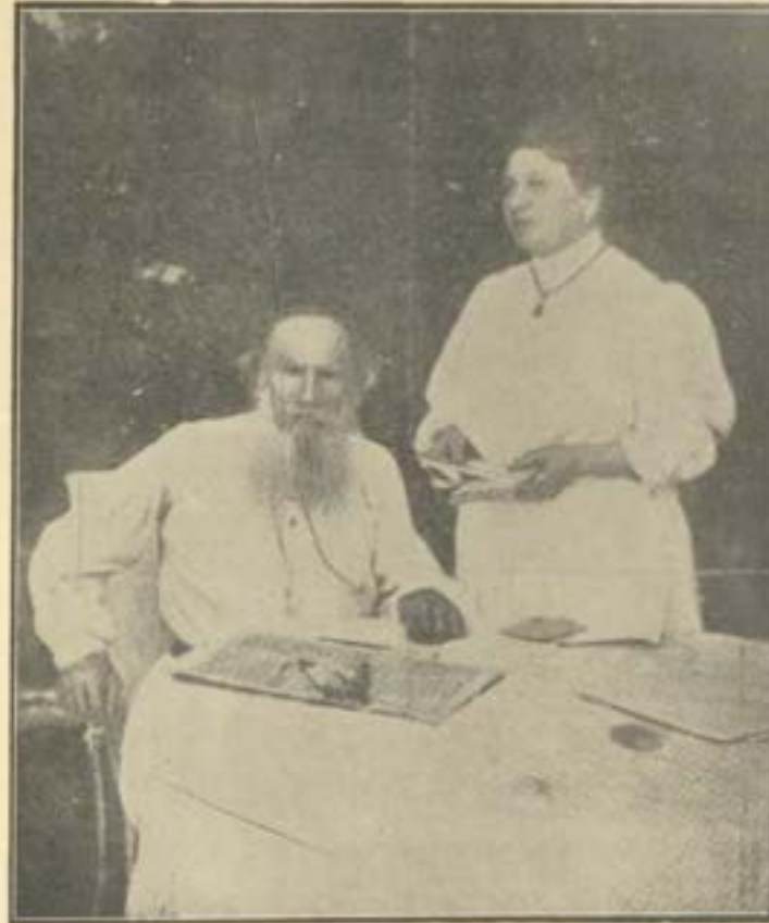
الفيلسوف تولستوي وزوجته

وقد ضمن هذه الكتب والروايات من الآراء والافكار ما يقضي بطرح الازهام والحرافات والصلف والعتو والاعتماد على طهارة السيرة والسريرة ومعاملة الناس بالحسنى الى حد انكار الذات واينثار الغبر على النفس وعدم الانقياد لسلطة اذا كانت تجبر المرء على ما يخالف ضميره . وقد قصد مرة ان يوزع املاكه كلها على الفقراء والمحتاجين ويعيش عيشة المسكنة والفقير مثلهم لكن زوجته ابت عليه ذلك حاسبة ان لاحق له ان يجرمها واولادها مما لهم . فنقل املاكه اليها والى اولاده وكان ببش عيشة الفلاحين