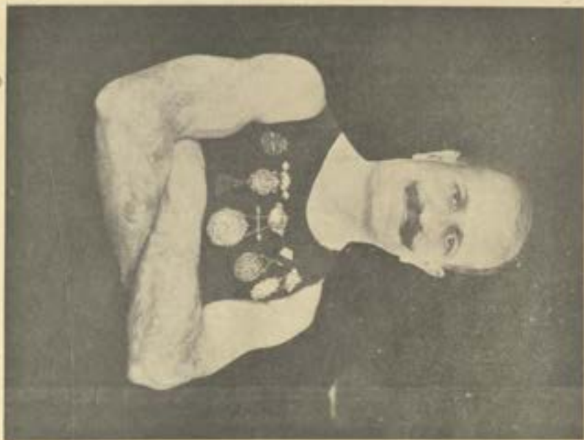
حنا يانت وقد تمسكتي سن الحامين لا يزال قادراً ان يرفع ٩٥ كيلو وذلك بفضل طريقته المنصّلة في صدر تدبير النزول من هذا الجزء مقتطف ديسمبر ١٩٢٨

كان لمصر نصيب كبير في هذه المسابقات فازت فيها على بعض الدول الكبرى حتى