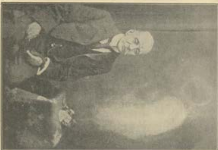
الجزرال السر الفرد تيز وصورة روح غير واضحة