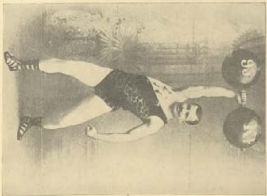
حنا يانت في سن الخامسة والستون يرفع من الكنتف ٩٥ كيلو ويثال بذلك لقب بطل العالم في الوزن الخفيف