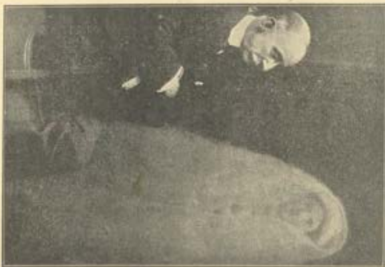
الجزرال السر الفرد تيز وصورة روح ابيه