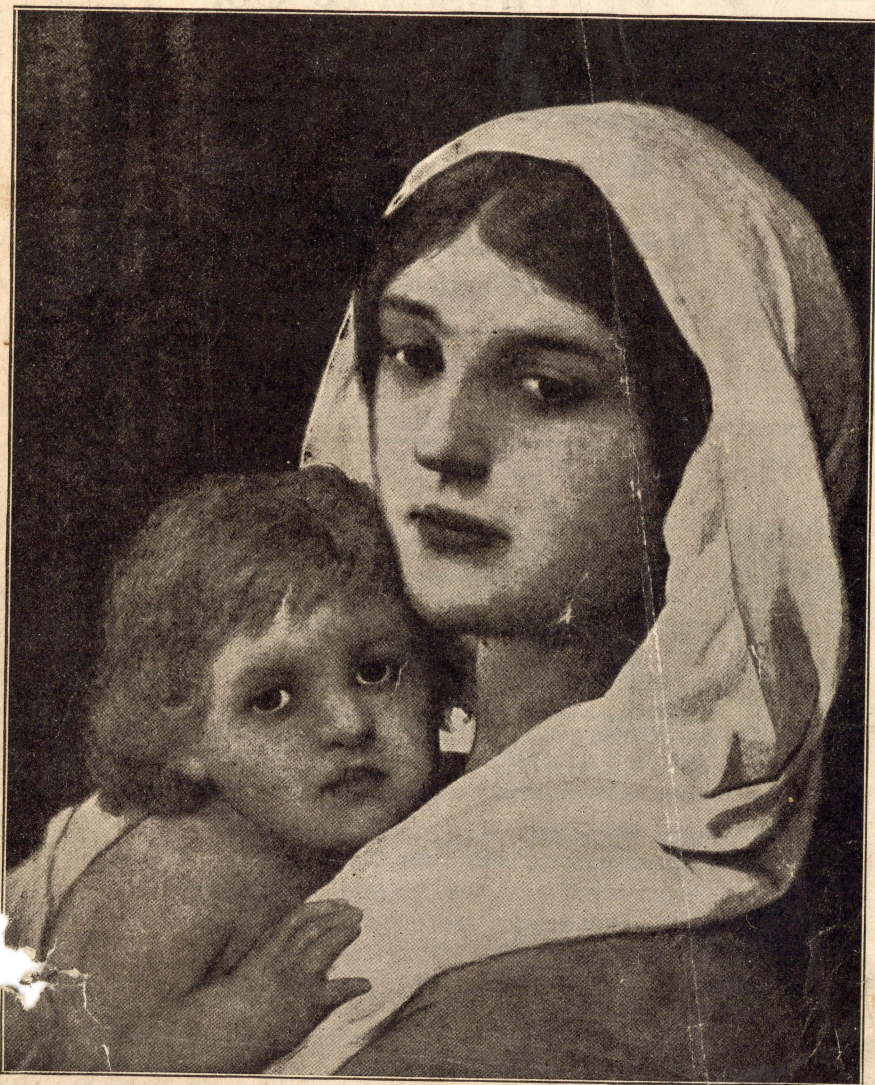
Madonnan med barnet.